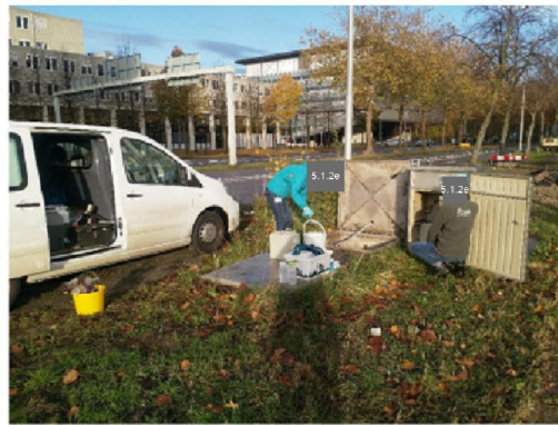
debietbepaling? => data van 5.1.2e