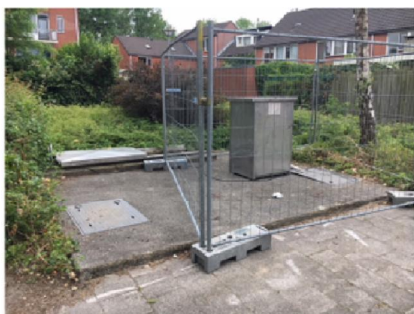
vergelijkbare opstelling als op schoolplein basisschool Lunetten (CPE onderzoek)